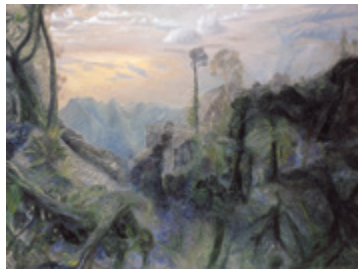
The sea with morning sun from Springbrook , 1996 Collection d'art de la QUT