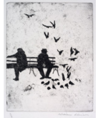
Feeding the birds , 1977-78 Collection d'art de la QUT