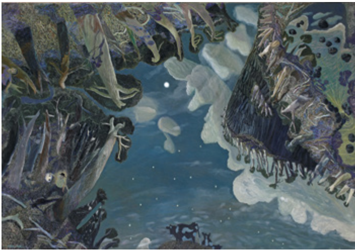
William by lamplight , 1990 Collection privée, Brisbane