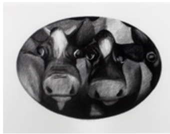
Cow portrait (Oval format) , 1979, Collection d'art de la QUT