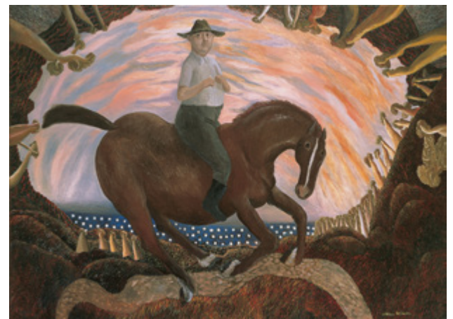
Equestrian self portrait , 1987 Collection d'art de la QUT