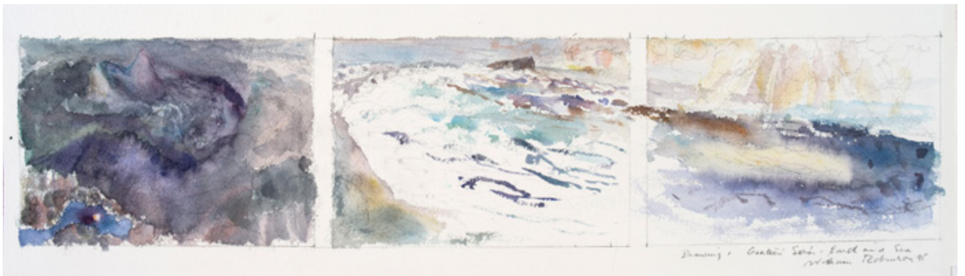
Creation landscape: Earth and sea II , 1995 Collection privée, Brisbane